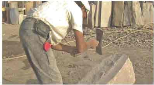
Taş işçiliği, Kayseri'de günümüzde de devam etmektedir

İşte bu yıllarda piyasada alüminyumun yaygın-