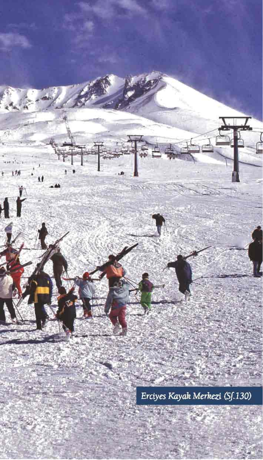
Erciyes Kayak Merkezi (Sf.130)