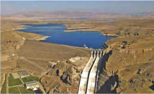
Kayseri'nin kuzey bölümünde yer alan Yamula Barajı

Dağcılık sporu ve kış turizmi açısından önemli bir yeri vardır. Aladağ (3.735 m), Dumanlı (3.024 m), Binboğa (2.856 m), Hınzır (2.500 m) ve Bakırdağ (2.462 m) ilin diğer önemli dağlardır.