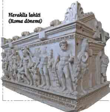
Heraklis lahiti (Roma dönemi)

Kültepe'nin ilk sakinleri olan Asurlulardan sonra bu bölge Hititlerin (M.Ö. 1800) hakimiyetine geçti. Kayseri içerisinde Hititlere ait eserlerden bazıları Develi ilçesinin Gümüşören (Fraktin) köyünde, Tomarza ilçesi İmamkulu köyünde, Pınarbaşı ilçesi Karakuyu köyünde, Saroğlan Çiftlik nahiyesinde, Erkiilet Karapınar köyünde, Hisarcık kasabasında ve Eğriköy'de yer alır. Hitit İmparatorluğu, M.Ö. 1200'lü yıllarda Anadolu'ya giren deniz kavimleri göçü ile ortadan kaldırdı.