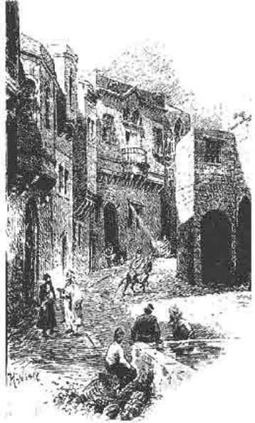
Kayseri'nin 19. yüzyıla bir sokak kesiti (üstte) 20. yüzyılda Kayseri (altta)

Kayseri; sanayisi, şehirciliği, sportif, sosyal ve kültürel gelişimi, yetiştirdiği siyaset ve devlet adamlarıyla Türkiye'nin en dikkat çeken şehirlerinden biridir.