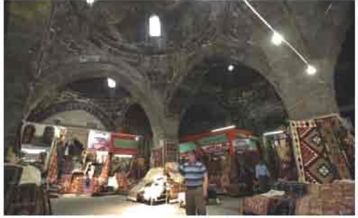
Halı ve kilim, Kayseri'nin el sanatı ürünlerinden biri olmasının yanı sıra ekonomideki önemini de sürdürmektedir.

Halıcılık: Şehirde el halıcılığının tarihi binlerce yıl öncesine gidebilmektedir. Selçuklularla birlikte doğudan getirilen el halıcılığı, Kayseri'de daha da gelişerek kendisine göre bir stil kazanmış ve geliş-