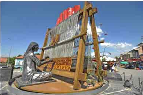
Halısı ile ün yapan Bünyan'da bulunan halı dokuma heykeli