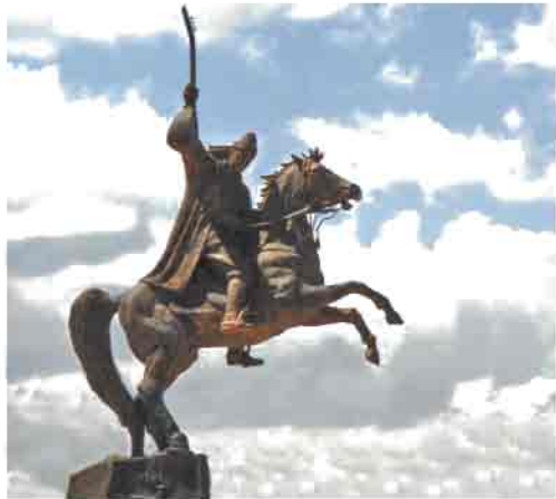
Develi'de bulunan Aşık Seyrani heykeli

Halk müziği ve halk oyunları kültürü yörede tüm canlılığını ve renkliğini sürdürmektedir. Davul-zurna, kaval, tef, zil, kaşık, bağlama çalma geleneği yaygındır. Kayseri aşıtları, gerek ezgisi ile gerekse sosyal olayları, sonraki nesillere aktarması yolu ile Türk Halk Edebiyatı'nda ve müziğinde önemli bir yer tutar. Dadaloğlu, Seyit Osman, Karacaoğlu, Seyrani, Aşık Hasan, Kerem, Garip gibi ozanların deyişleri yöre ezgilerinin söz kaynağını oluşturur. Kayseri'nin "Erkilet güzeli", "Gesi bağları", "Germir bağları", "Ağam İstanbul'u mesken mi tuttu?", "Süpürgesi yoncadan" gibi çok tanınan ve sevilen türküleri vardır.