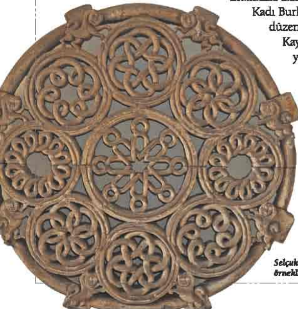
Selçuklu taş işçiliğinin güzel örneklerinden biri