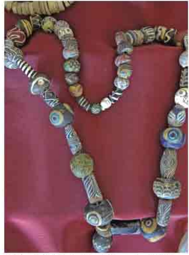
Kültepe'de bulunan Roma dönemine ait kolye

Kayseri ve çevresindeki ilk yerleşim alanı, şehrin 20 kilometre kuzey doğusunda yer alan ve Anadolu'nun en eski yazılı kaynaklarının bulunduğu Kültepe (Kaniş-Karum) Höyüğüdür. M.Ö. 3 binden Roma dönemine kadar önemini koruyan bu merkezde yerleşim Erken Tunç Çağı'nda başlar.