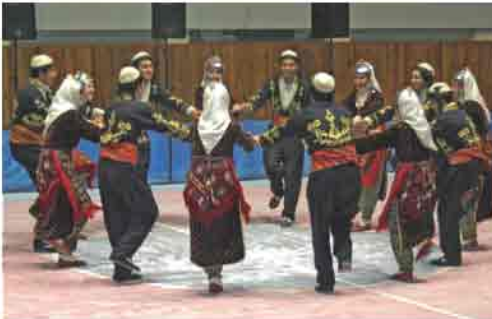
Kayseri'nin kadın-erkek birlikte oynanan halkoyunlarından biri

Anadolu 'nun pek çok yöresinde olduğu gibi Kayseri'de de yaz aylarında sürekli yerleşmelerden, yüksek, serin, güzel manzaralı yerlere göç etmek geleneksel bir yaşam biçimidir. Bununla birlikte, Kayseri bağcılığının kendine özgü yanları vardır. Bağcılık, şehir merkezi başta olmak üzere, Erciyes Dağı'nın çevresindeki bazı kasaba ve köylerde yaşayanlar için de yaz aylarında önemli bir faaliyetdir. Yazlı belgelere göre Kayseri'de bağların varlığı 15. yüzyıla kadar uzanmaktadır. Bu da bağcılığın Kayseri'de ne kadar köklü bir gelenek olduğunu ortaya koymaktadır.