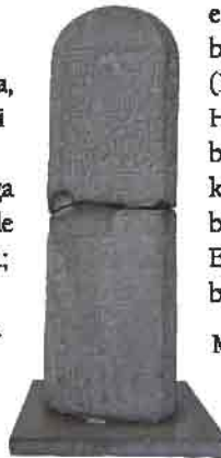
Çivi yazısı ile yazılmış bir Hitit kitabesi.

Doğal ve tarihi anayolların üzerinde bulunan Kayseri, Erken Tunç Çağı'ndan bu yana, önemli bir yerleşim merkezi oldu. 5 bin yıl öncesinden günümüze pek çok uygarlığa beşiklik eden ve her dönemde önemini koruyan Kayseri ili; Asurlular, Hititler, Kilikya Krallığı, Persler, Kapadokya Krallığı, Roma-Bizans İmparatorluğu, Ana-dolu Selçukluları, Beylikler ve Osmanlı Devleti'ne ev sahipliği yaptı.