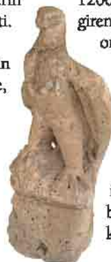
Roma dönemine ait kartal heykeli

1200'lü yıllarda Anadolu'ya giren deniz kavimleri göçü ile ortadan kaldırıldı. Bu tarihten itibaren Geç Hitit Şehir Devletleri kuruldu. Bu devletlerden Tabal Krallığı, Kayseri sınırları içerisinde yer alır. Akkoşla ilçesi Kululu beldesinde bulunan kalıntılar, bu krallığın başkenti