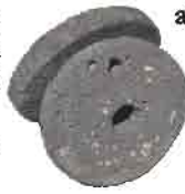
Bulgur Öğütme taşı

Çok sayıda medeniyete ev sahipliği yapan Kayseri, adeta bir kültür beşiğidir. Kayseri'nin örf ve adetleri, oyunları ve müziği İç Anadolu'nun yayla özelliğini taşır. Türkü, mâni, masal, bilmece ve efsâne bakımından çok zengindir. Aşık Edebiyatı'nda önemli isimler