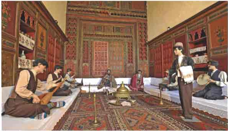
Kayseri'nin misafir ağırlama, müzik ve eğlence geleneklerini anlatan bir fotoğraf (Etnografya müzesi)

Selçuklu Türklerince fethedilen Kayseri o tarihten bu yana Türk-İslam kültürü ile yoğurulmuştur. Düğün-nişan ve sürnet törenleri, bağcılık, misafir ağırlama, dini bayramlar ve törenler Kayseri'nin Türk-İslam kültürünü anlatan özelliklerinden belli başlılardır.