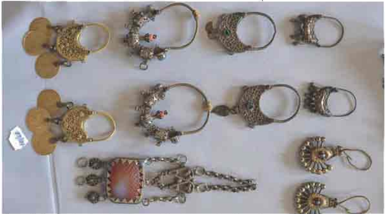
Kayseri'nin geleneksel takılarından örnekler (Etnografya Müzesi)

giyerlerdi. Bugün bunlar hemen hemen yok denecek kadar azalmıştır. Ancak meraklı ailelerde birer antika eşya olarak saklanmaktadır.