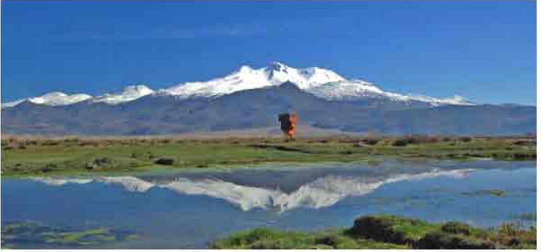
Erciyes Dağı'nın Sultan Sazlığı Kuş Cenneti'nden görünümü

yüksek kesimlerinde yer yer iyi orman örtüsüne rastlansa da topraklar genellikle bozuk orman ve çahlıklar ile kaphdır. İlin güney kesiminde Toros dağlarının yer aldığı