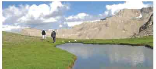
Aladağlar Millî Parkı içinde bulunan Yedigöller

Gölleri: İlin önemli gölleri Camız Gölü, Çöl Gölü, Sangöl, Yay Gölü ve Tuzla Gölüdür. Bunların yanı sıra çeşitli büyüklüklerde barajlar ve göletler vardır. Bunlar Ağcaşar, Akköy, Kovalı, Sarımsaklı, Selkapanı ve Yamula Barajları ile Elkere, Karakuyu, Şihli, Tekir, Zincidere göletleridir.