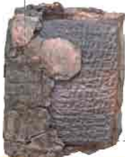
Kültepe'de bulunan bir Asur tableti

Mezopotamya'nın kuzeyine yerleşen Asurlular, Anadolu'da "Karum" adını verdikleri büyük ticaret kolonileri kurdular. Bunlar