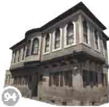
Kayseri Kalesi (Sf.80)