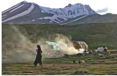
Tekir yaylasında çadır kurmuş bir köylü ailesi

Ovaları: Erciyes Dağı'nın güney ve güney batısında yer alan Develi Ovası (1.050 km 2 ) kapalı havza niteliğinde bir çöküntü alanıdır. İlin diğer önemli ovaları ise Sarımsaklı Ovası (300 km 2 ), Karasaz Ovası