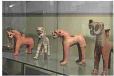
M.Ö. 2000'lere ait rithonlar

Karapınar köyünde, Hisarcık kasabasında ve Eğriköy'de yer alır. Hitit İmparatorluğu, M.Ö. 1200'lü yıllarda Anadolu'ya giren deniz kavimleri göçü ile ortadan kaldırdı. Bu tarihten itibaren Geç Hitit Şehir Devletleri kuruldu. Bu devletlerden Tabal Krallığı, Kayseri sınırları içerisinde yer alır. Akkuşa ilçesi