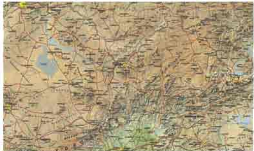
Kayseri ve çevresinde dağlar ve ovalar geniş bir yer tutar

Sıcaklık: Kayseri'de en sıcak günler Temmuz ve Ağustos aylarında olup bazen 38 dereceye kadar yükselir. Bu ayların ortalama sıcaklığı