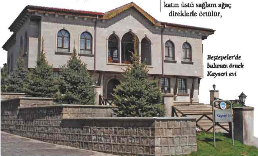
Beştepele'de bulunan örnek Kayseri evi

Müslümanların evlerinde, ayrı ayrı oturma odası (haremlik-selamlık) inşa edilirdi. Evlerin ve bodrum katın üstü sağlam ağaç direklerle örtülür,