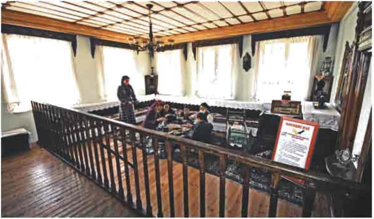
Beştepeler mesire alanında bulunan örnek Kayseri evinin iç tarafı (sofa bölümü)

üstü tahta ile kaplanır, damlarda 25-35 cm kalınlığında toprak komudur. Odaların kapısı genelde avluya açılır, duruma göre holden ocalara geçildiği de olurdu. "Tokana" en dipte olan oda idi. Evin en kullanış yeri olup, çeşitli maksatlar da kullanıldığı olurdu. Örneğin çeşitli ev eşyası, sandık, çeyiz sandığı, beşik, fazladan bulundurulmuş yatak yorgan vb. uygun bir şekilde yerleştirilirdi. Tokanadan karanlık ufak bir odaya (kiler) geçilir, burada turşu, gilaboru, havuş küpler, un ambarı, toptan