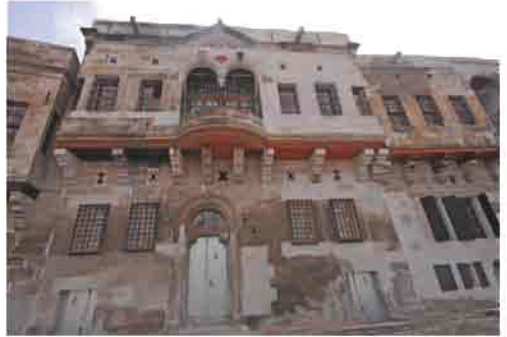
Kayseri tarihi dokusunun önemli bir parçası; Kayseri evleri

Kayseri'de özellikle 1950'li yıllardan itibaren görülen büyük değişimler mimariye de yansımıştır. Böylece mevcut geleneksel dokunun yan sıra modern oluşumlar gözlenmiştir. Geleneksel yerleşim dokusu, yapılanğı dönemin coğrafi, sosyo-kültürel, ekonomik,