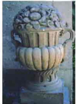
Bir taş süsleme örneği

Yöredeki taşların yumuşak olması ve zamanla sertleşmesi işlenmesini de kolaylaştırmaktadır. Bu nedenle geleneksel Kayseri Evleri ve tarihi eserlerde taş işlemeciliğinin en güzel örneklerini görmek mümkün olmaktadır.